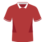
Pays de Galles